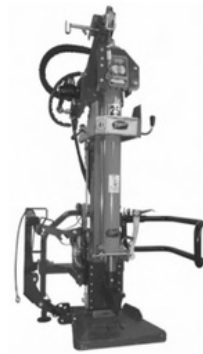
Modell 220VPF, 250VPF, 300VPF