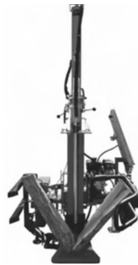
Modell 130BM, 180BM