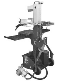
Modell 110 - 180HVP