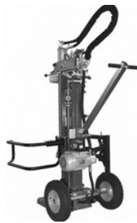
Modell 1300EL, 1800EL, 2000EL