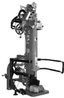
Modell 1300VPF, 1800VPF, 2000VPF