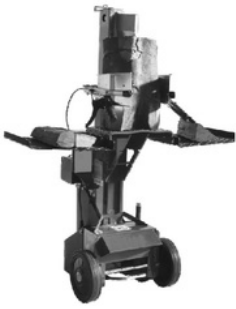
Modell 65EL, 85EL