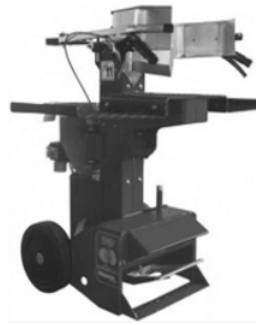
Modell 90EL, 110EL