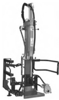
Modell 130VPF, 150VPF, 180VPF