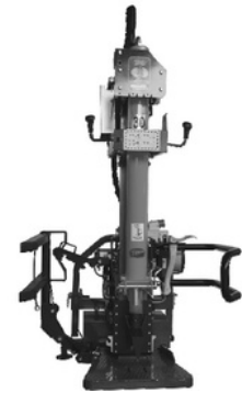
Modell 2500VPF, 3000VPF